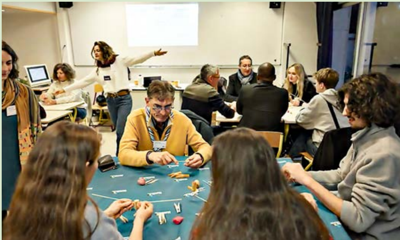
Ateliers participatifs au cours du colloque

La première partie de l'après-midi donne la parole à des experts aux regards croisés :