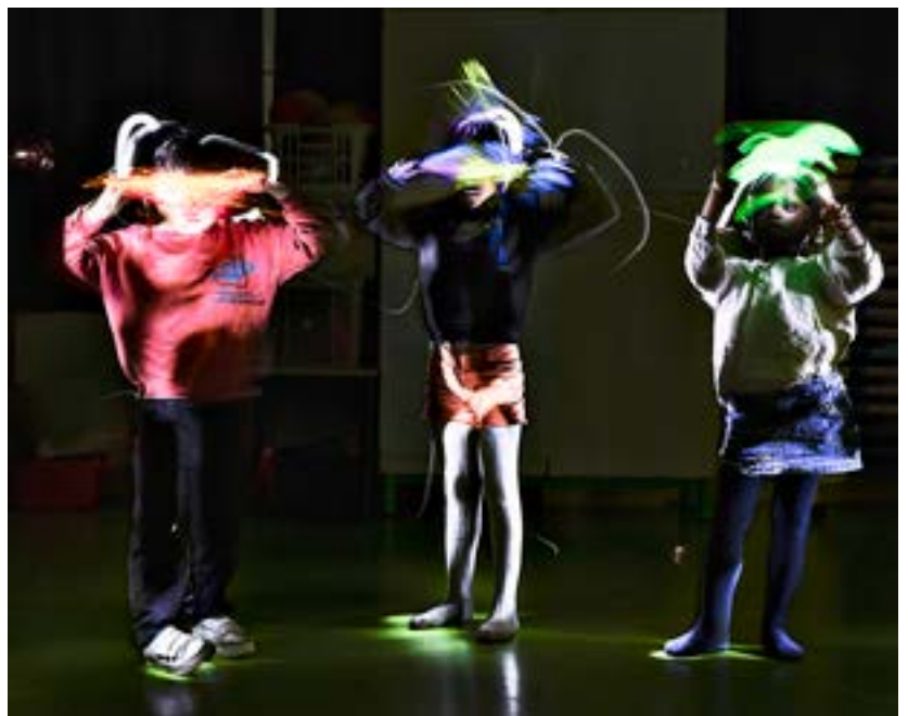
Faire créer les jeunes, retrouver une densité humaine