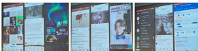
Qu'est-ce que vous faites avec vos smartphones ?

Mais le véritable geste critique surgit ailleurs :