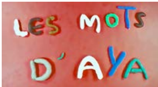
Polémique autour des mots d'AyaNakamura

Un élève plus âgé, interviewé par un des CM2 de la classe, explique : « C'est de la ré-